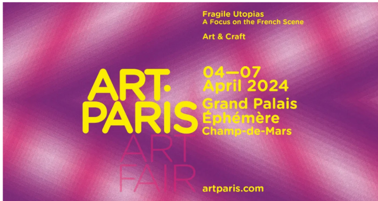
Art Paris 2024

30 janvier 2024 à 9h00 par Solène Cordier